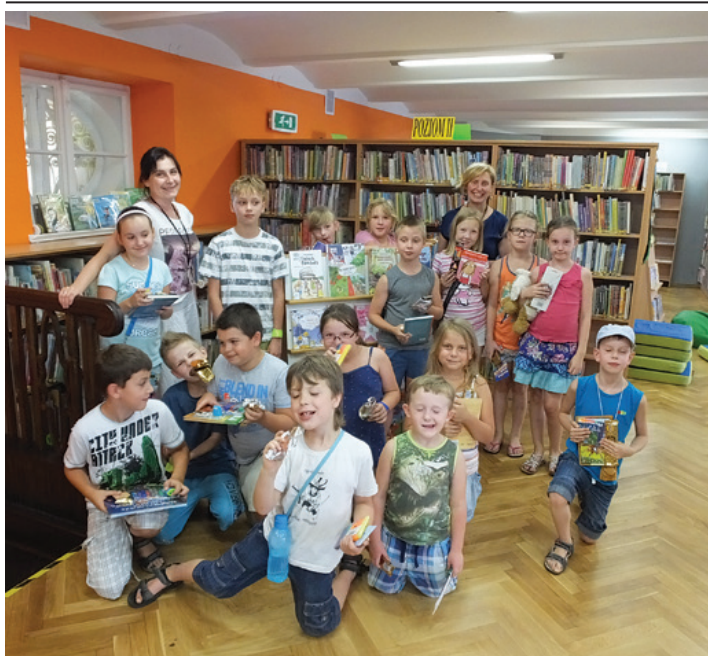
W bibliotece cały czas dzieje się coś ciekawego.

W czasie letniej kanikuły Oddział dla dzieci Biblioteki Miejskiej w Cieszynie tętnił gwarem i śmiechem dzieci, które odwiedzały nas, by właśnie w bibliotece miło i ciekawie spędzić wolny czas. Podczas dwóch wakacyjnych miesięcy biblioteczna grupa Molików czytała, wykonywała najrozmaitsze prace plastyczne i doskonale wspólnie bawiła się.