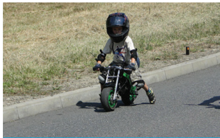
Każdy chciał spróbować swoich sił na dwóch kółkach.