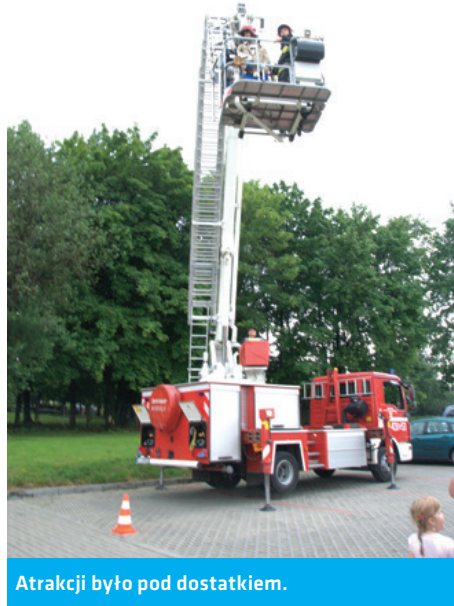
Atrakcji było pod dostatkiem.

Mimo niesprzyjającej pogody cieszył się on dużym zainteresowaniem. Dzieci korzystały z mnóstwa atrakcji przygotowanych przez organizatorów oraz niezawodnych strażaków ochotników, uczestniczyły wraz z rodzicami i opiekunami w konkursach, zabawach i rozgrywkach sportowych.