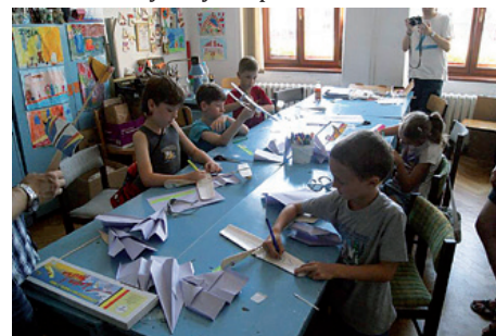
Warsztaty „Modelarskie ABC”.

Pozostający w Cieszynie w tegoroczne wakacje nie mogli narzekać na nudę. Dom Narodowy przygotował bardzo bogaty i urozmaicony program. Każdego dnia odbywały się atrakcyjne zajęcia w formie cyklu warsztatów, pokazów, plenerów, wycieczek i tematycznych spotkań.