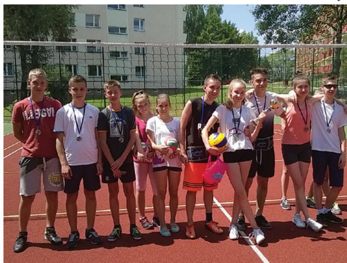
Zajęcia odbywały się także na świeżym powietrzu.