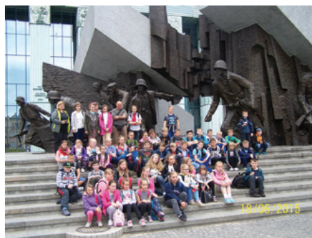
Przedwakacyjne zwiedzanie stolicy.