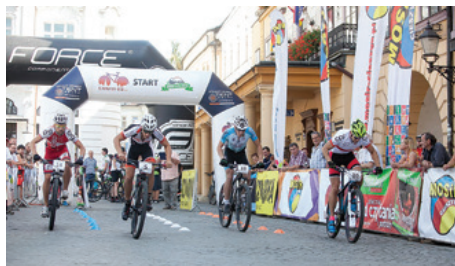
Rywalizacja na ulicach Cieszyna była bardzo widowiskowa.