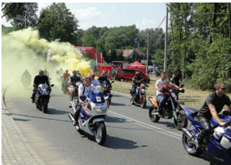
Zawody odbyły się już po raz trzeci.

23 sierpnia na ul. płk. Gwido Langera w Cieszynie odbył się amatorski wyścig motocyklowy O Błękitną Wstęgę Olzy . Była to już trzecia edycja wyścigu i podobnie jak w latach ubiegłych przyciągnęła liczną rzeszę kibiców. W zawodach wystartowało 56 motocyklistów, którzy rywalizowali ze sobą na odcinku ok. 400 metrów w sześciu kategoriach (Naked-bike, Classic do 1985, Sportowe/Turystyczne do 600 ccm, Enduro/Cross, Sportowe/Turystyczne pow. 600 ccm, kobiety). Na najlepszych czekały