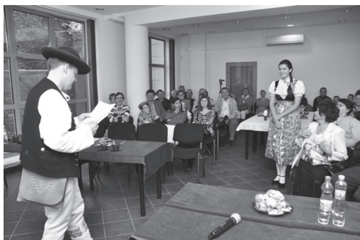
Gwarowy maraton odbędzie się po raz drugi.