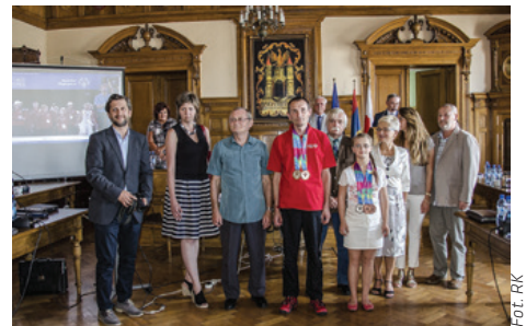
Olimpijczycy na Salii Sesyjnej.