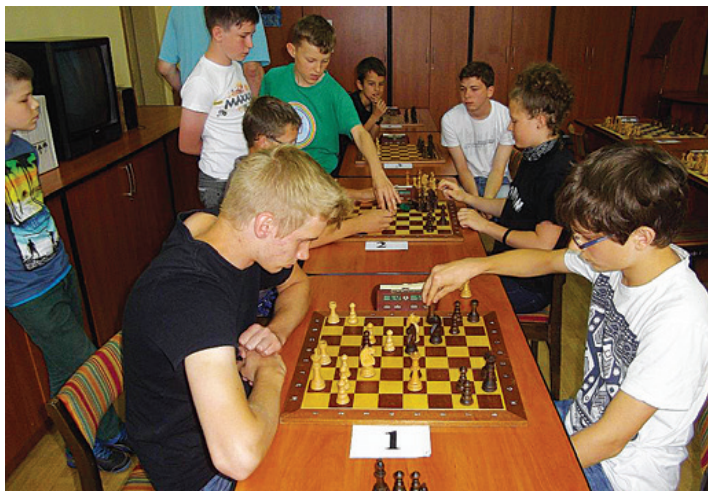
Zmagania przy szachownicy.

Każde dziecko zapewne chciałoby, aby wakacje jeszcze trochę trwały. Niestety astronomiczne lato dobiega końca, a w szkołach rozbrzmiały już pierwsze dzwonki.