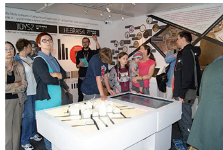
Zwiedzanie „Muzeum na kółkach”.

Można było m.in. posłuchać muzyki w Parku Pokoju, wziąć udział w festiwalach Wakacyjne Kadry i Kręgi Sztuki, poznać historię polskich Żydów w Muzeum na kółkach, zatańczyć z zespołem Klezmer , zostać małym artystą (na plenerze malarskim, w pracowni ceramicznej, podczas warsztatów plastyczno-teatralnych).