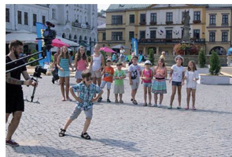
Na Rynku dzieci dobrze się bawiły kręcąc teledysk.