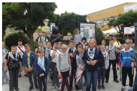
W kolonii uczestniczyło 80 dzieci.

Niewątpliwymi atrakcjami były wycieczki do muzeów znajdujących się w zabytkowych pałacach oraz spacer po nieczynnej kopalni węgla brunatnego Babina , gdzie obok siebie znajdowały się zbiorniki wodne z różnokolorową wodą.