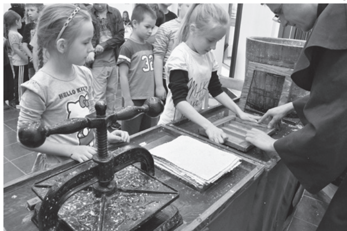
Dzieci podczas warsztatów czerpania papieru.