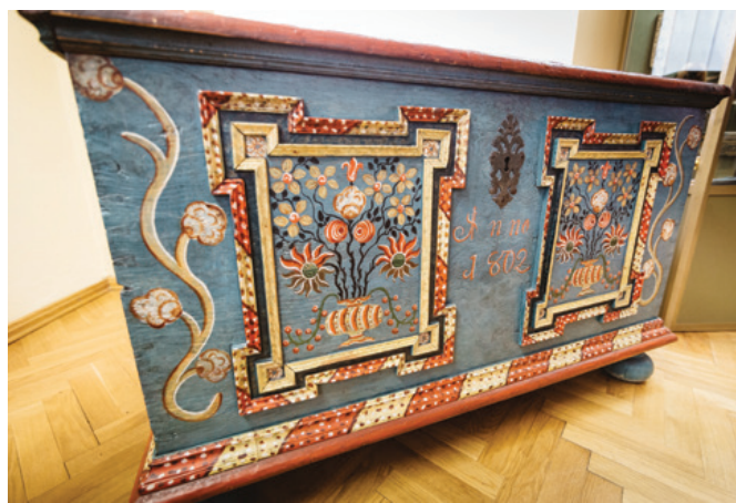
Ta trówa ma już ponad 200 lat.

– Taką kolorową skrzynię panna młoda otrzymywała od rodziców jako posag. To zwyczaj, który nie przetrwał do dziś. Część skrzyń od dawnych czasów strawiły płomienie, inne zjadły robaki, na szczęście sporo ich się zachowało. Na przykład w naszym muzeum mamy 40 skrzyń, najstarsze pochodzą z końca XVIII wieku – opowiada Grzegorz Studnicki.