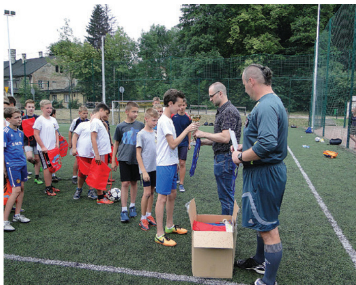
Przygotowano wiele upominków i medali.

Jednak ci, którzy postanowili aktywnie spędzić wakacyjną przerwę razem z Miejskim Ośrodkiem Sportu i Rekreacji w Cieszynie będą mieli co wspominać przez cały rok szkolny. Jak co roku MOSiR realizował program aktywnego wypoczynku dla dzieci z cieszyńskich szkół podstawowych i gimnazjalnych.