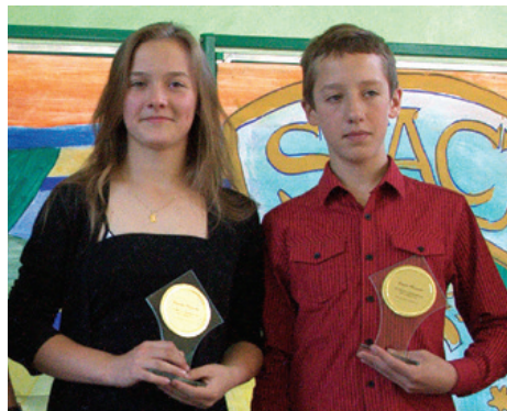
Zdolne rodzeństwo z Cieszyna.

W szkole zdolne rodzeństwo otrzymało statuetki dla wybitnych absolwentów. Życzymy im w gimnazjum dalszych sukcesów.